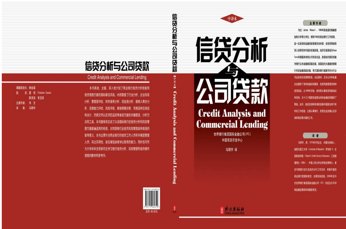
世界银行集团国际金融公司 (IFC) 中国项目开发中心马明学译, 外文出版社 2010 年 2 月出版发行